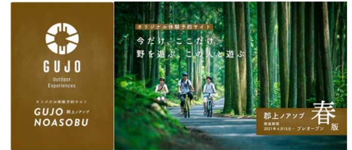
郡上ノアソブ アウトドア期間限定体験サイト