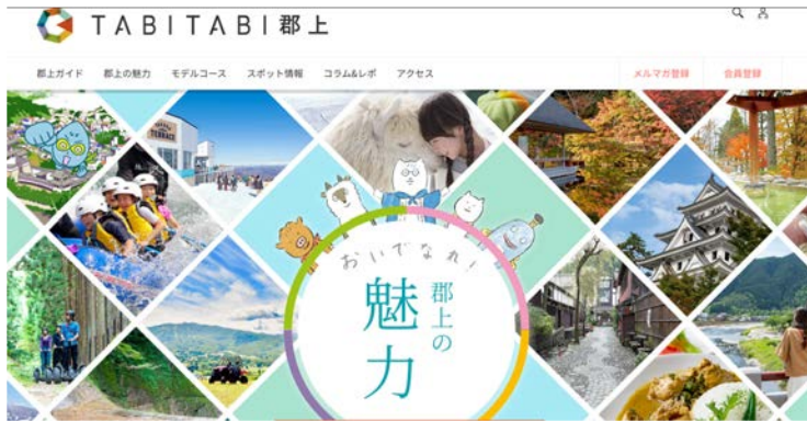
Tabitabi郡上 観光全体ポータルサイト