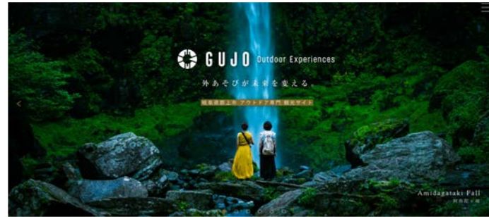
Gujo Outdoor Experience アウトドア全体ポータルサイト